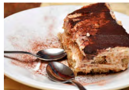
... eine kleine Aufmerksamkeit ...