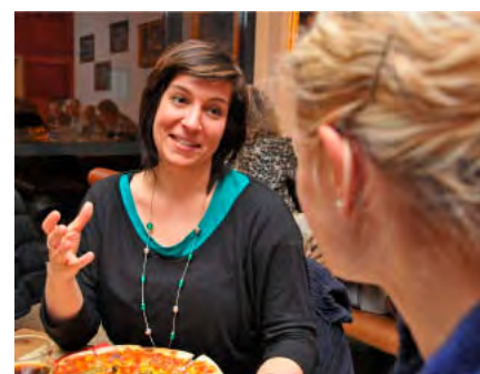
Ein gutes Gespräch und ...

Grafik: J. Oberle