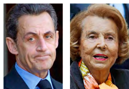
Ex-Präsident Nicolas Sarkozy und L'Oréal-Erbin Liliane Bettencourt.

Der Termin endete für den 58-Jährigen äußerst unangenehm. Die Justizvertreter leiteten nach jahrelangen Ermittlungen ein offizielles Anklageverfahren gegen den Ex-Präsidenten