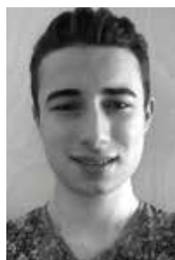
Miguel Helm ist freier Mitarbeiter des Südkuriers.

Umsetzung Heinsch und Helm interviewten Freunde, die ihnen ihre Wohnsituation schilderten und ihre Wahl begründeten. In der sechsteiligen Serie, die daraus entstand, wird das ganze Spektrum