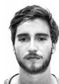
Marc-Julien Heinsch ist freier Mitarbeiter des Südkuriers.

Reaktionen „Es gab viele positive Rückmeldungen“, sagt Helm. „Die Serie zeigt ein authentisches Bild der Wohnlage in Konstanz aus Sicht der Studenten“, erklärt er den Erfolg.